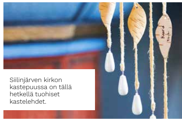
Siilinjärven kirkon kastepuussa on tällä hetkellä tuohiset kastelehdet.

Seurakunnan molemmissa kastepuissa käytetään samoja kastelehtiä. Kastetun perhe päättää kumpaanko kastepuuhun haluaa kastetun nimen kiinnitettävän. ●