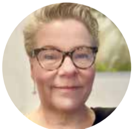
KOLUMNI Minna Karpinen