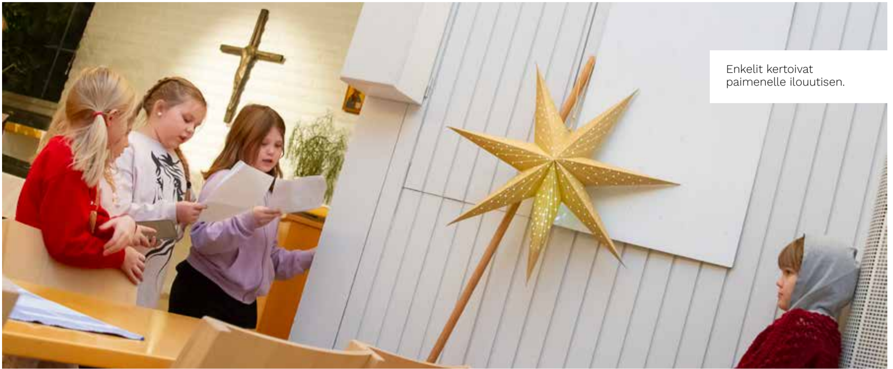
Enkelit kertoivat paimenelle ilouutisen.

Vauvan itkua kaiuttimista, tähden loistoa, lasten supinaa ja naurua. Karttulan seurakuntatalolla on käynnissä kolmannet joulukuvaelman harjoitukset.